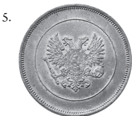
10 пенни 1917 года Герб