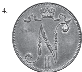
10 пенни 1917 года Вензель